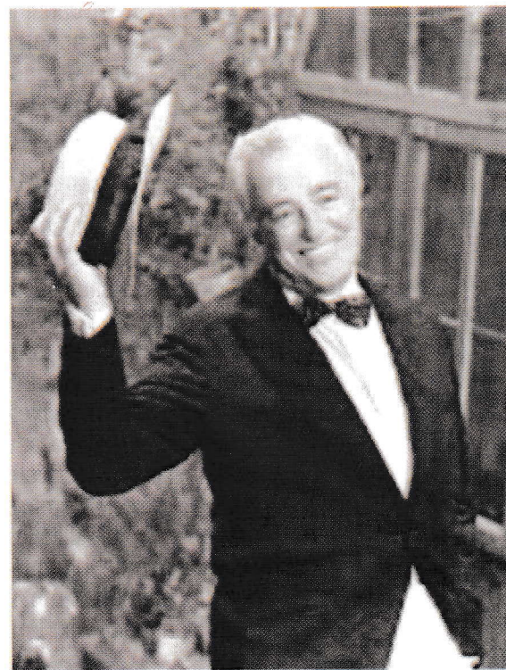
Vittorio De Sica